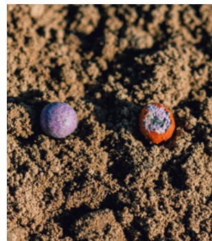
SMART KWS suikerbietenzaad: Paarse binnenkleur